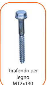
Tirafondo per legno M12x130