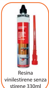
Resina vinilestirene senza stirene 330ml