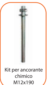
Kit per ancorante chimico M12x190