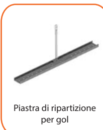
Piastra di ripartizione per gol