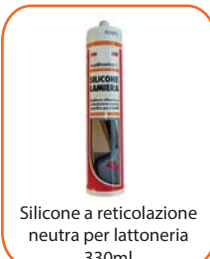
Silicone a reticolazione neutra per lattoneria 330ml