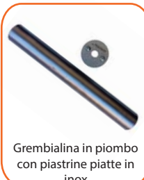
Grembialina in piombo con piastrine piatte in inox