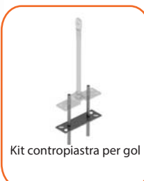
Kit contropiastra per gol