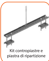
Kit contropiastre e piastra di ripartizione