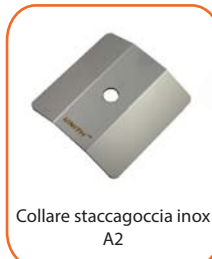
Collare staccagoccia inox A2