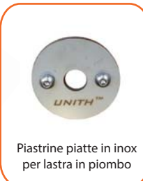
Piastrine piatte in inox per lastra in piombo