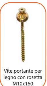
Vite portante per legno con rosetta M10x160