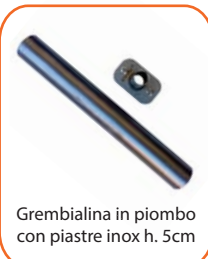
Grembialina in piombo con piastre inox h. 5cm