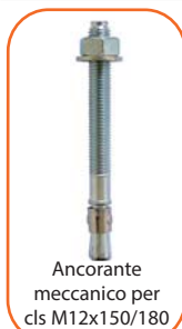
Ancorante meccanico per cls M12x150/180