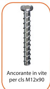
Ancorante in vite per cls M12x90