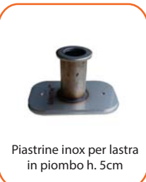
Piastrine inox per lastra in piombo h. 5cm