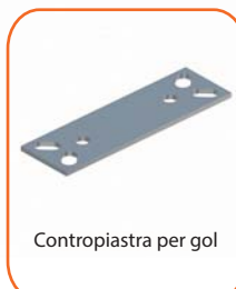
Contropiastra per gol