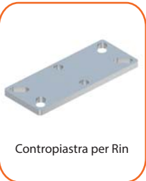
Contropiastra per Rin