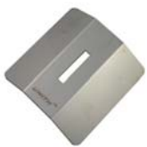
Collare staccagoccia inox A2